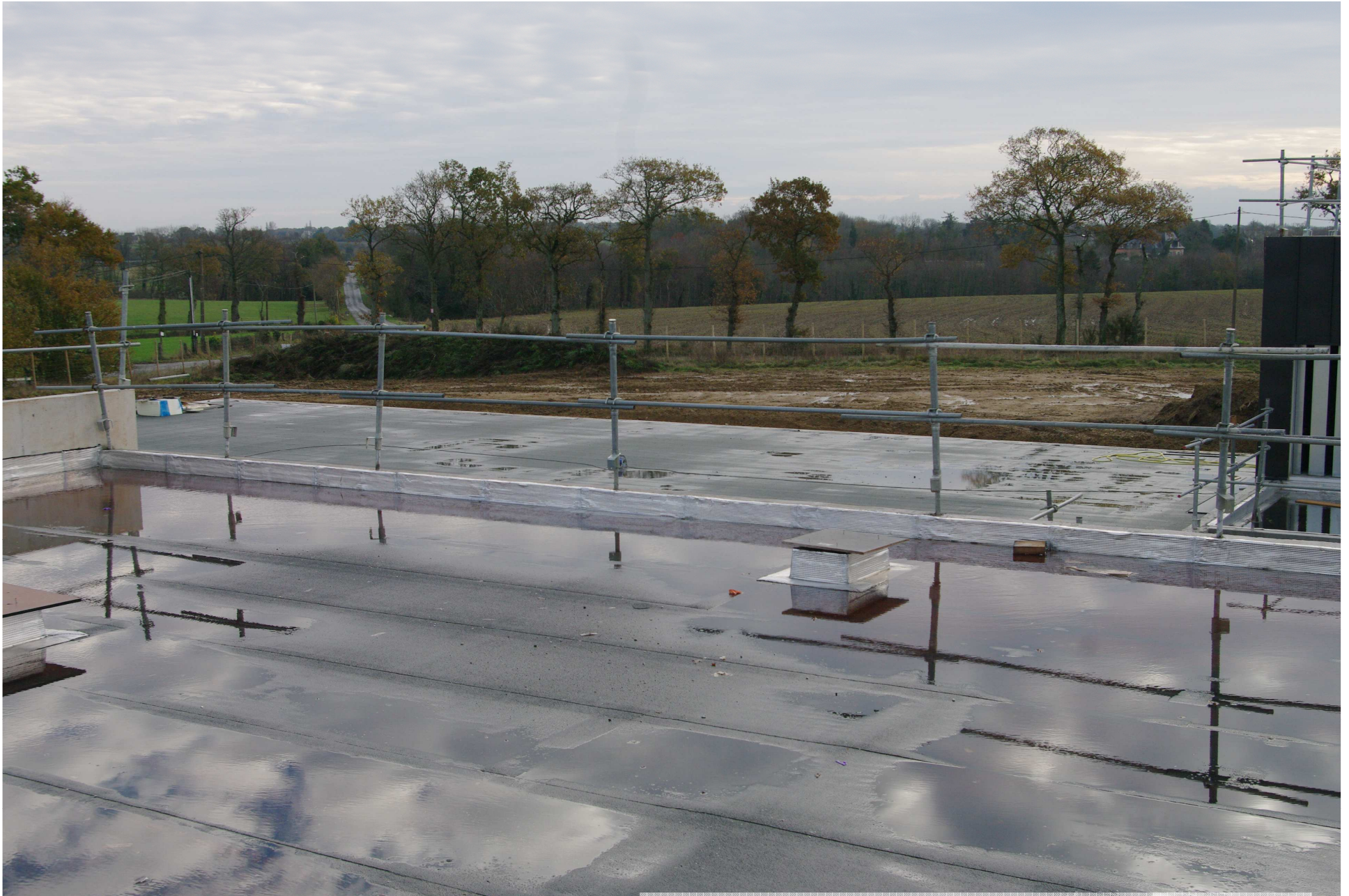
Bâche de stockage de l'eau traitée 2000 m 2