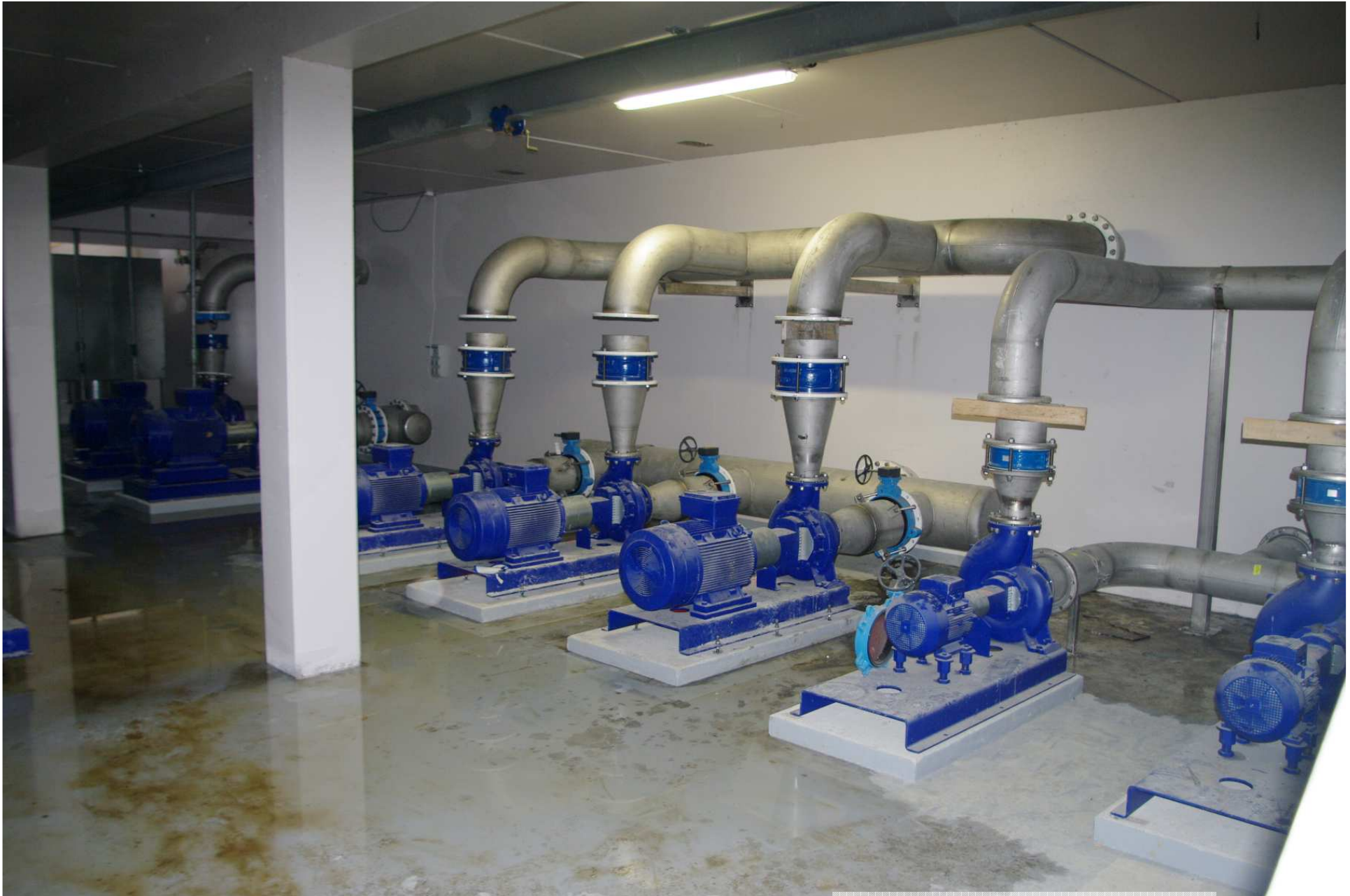
Pompes de refoulement