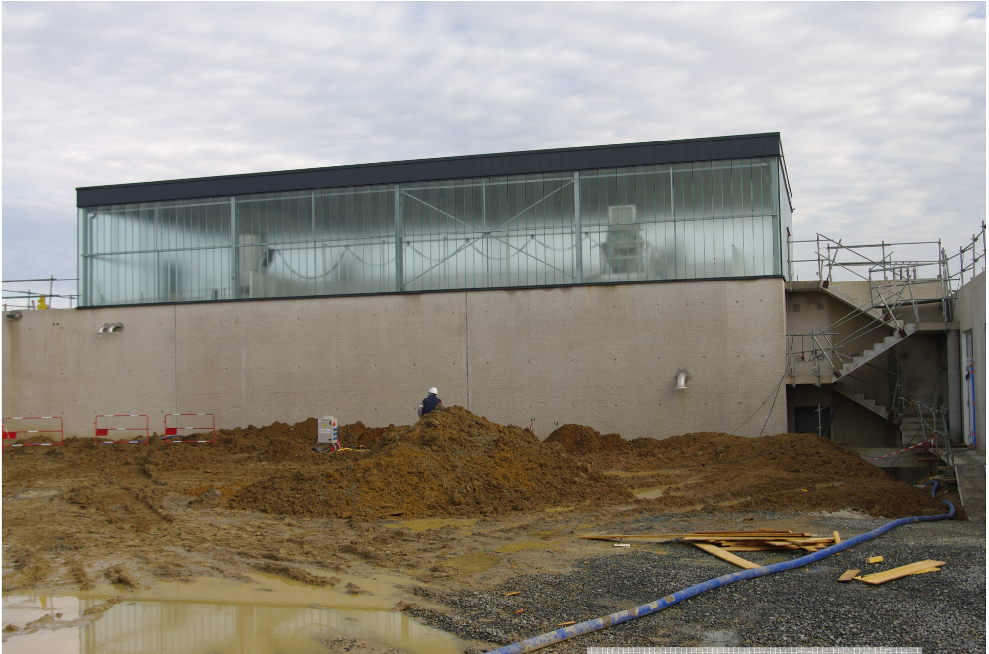
Bâtiment des filtres carboflux