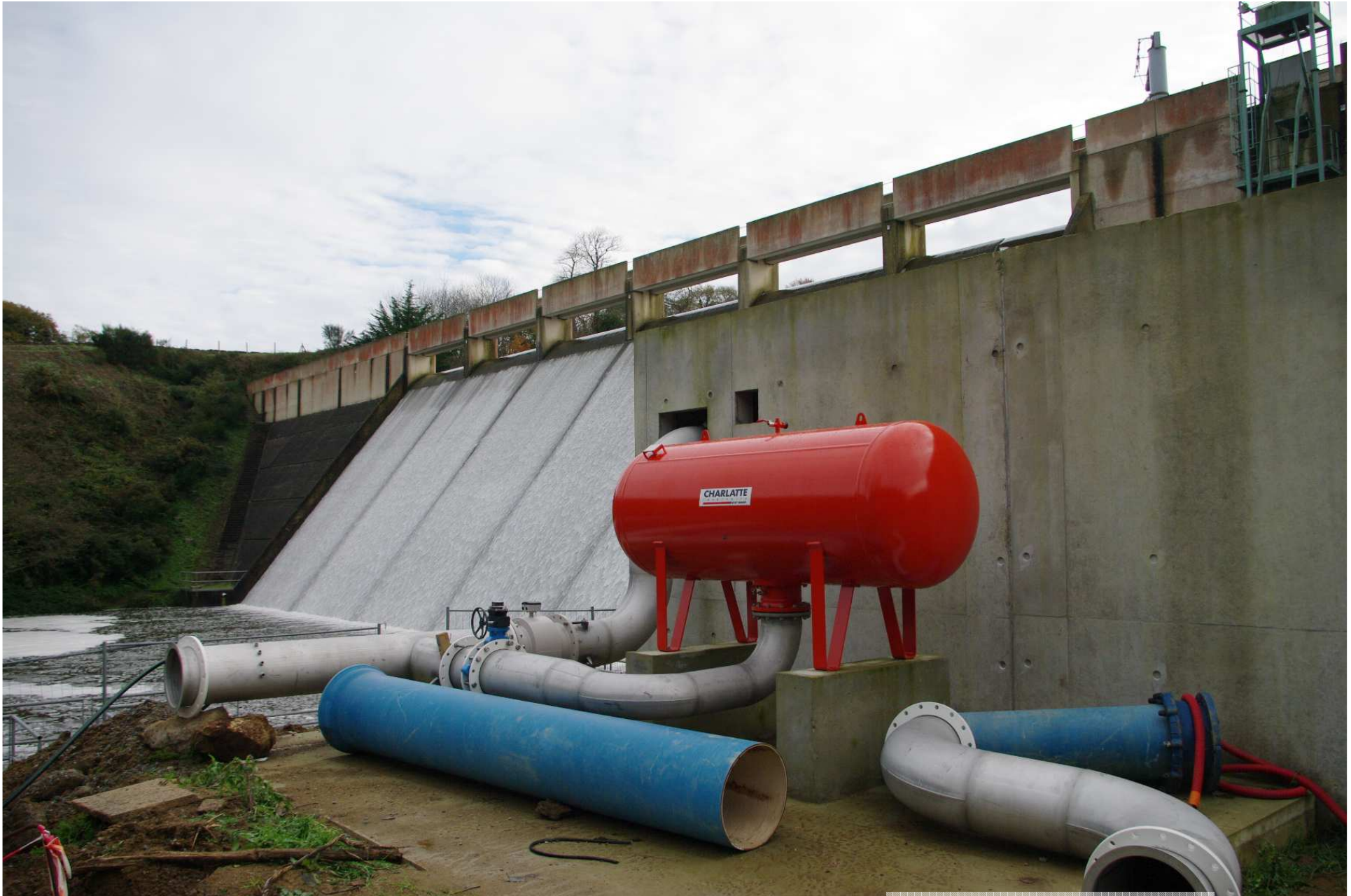
Station de pompage