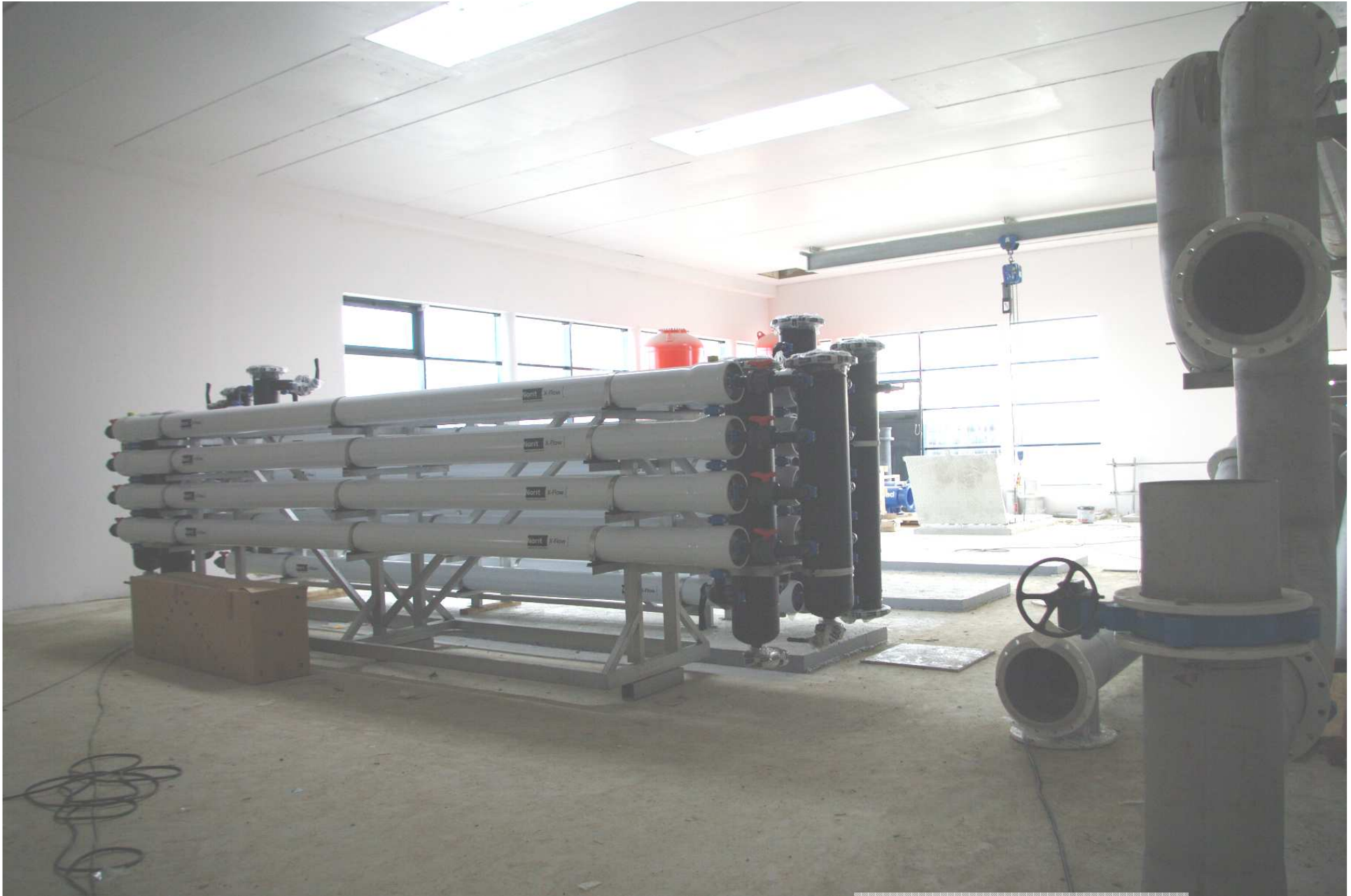
Filtres à membranes