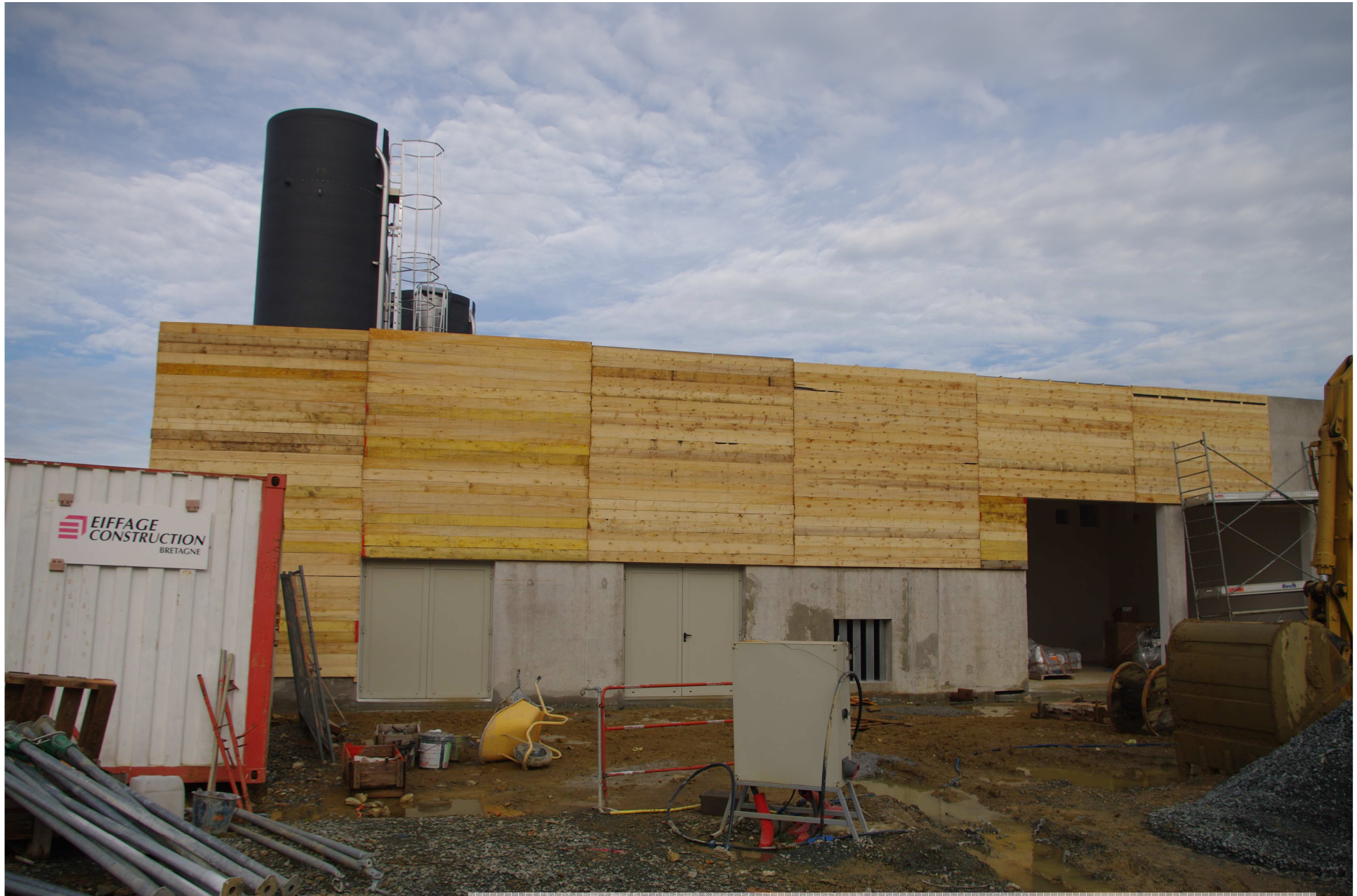
Bâtiment stockage des réactifs et traitement des boues